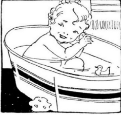
Je me lave.