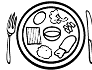
Mon repas est équilibré.