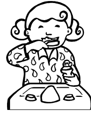
Je brosse mes dents.